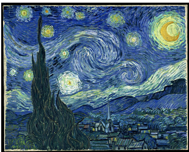
A Noite Estrelada. Vincent Van Gogh. 1889.