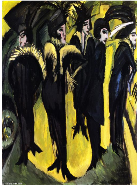
Cinco Mulheres na Rua. Ernst Kirchner. 1913.

O movimento Expressionista surge como uma resposta ao Impressionismo. Os artistas expressionistas criticavam a arte impressionista que buscava retratar os efeitos de luzes e cores em pinturas, porém não retratavam as inquietações e emoções humanas. Já a Expressionista tinha justamente este objetivo: representar o mal-estar que dos artistas da época diante dos problemas da sociedade.