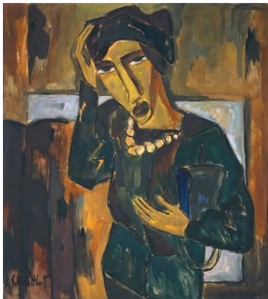
Woman with a Bag . Karl Schmidt-Rottluff. 1915.

As obras expressionistas eram consideradas melancólicas e angustiantes, por usarem cores mais escuras, e distorcerem propositalmente a realidade. Elas representavam uma visão pessimista e sombria do mundo e iam contra os ideais de equilíbrio e harmonia nas formas e nas cores. Esse foi o primeiro grande movimento artístico do século 20 e influenciou diversas vanguardas modernistas que surgiram nos anos seguintes.